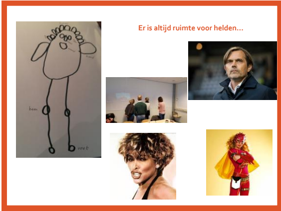
Er is altijd ruimte voor helden...